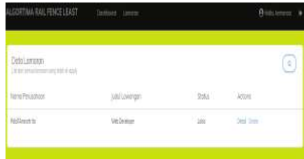
Gambar 8. Tampilan Menu Home Sistem Bagian Calon Pekerja

Pada menu ini berisikan informasi tentang jenis lowongan pekerjaan yang ada pada sistem rekrutman, dapat dilihat pada gambar dibawah ini: