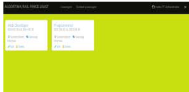
Gambar 3. Menu Home Perusahaan

Pada menu ini perusahaan dapat melihat menu lowongan dan menambahkan daftar lowongan kerja untuk calon pekerja, Seperti dilihat pada gambar dibawah ini: