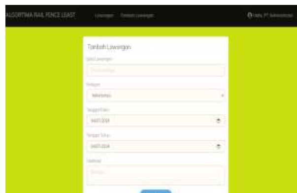
Gambar 5. Menu Tambah Lowongan Pekerjaan

Pada menu ini Admin perusahaan dapat menambahkan judul dan deskripsi dari lowongan yang akan di inputkan kedalam sistem, dapat dilihat pada gambar di bawah ini: