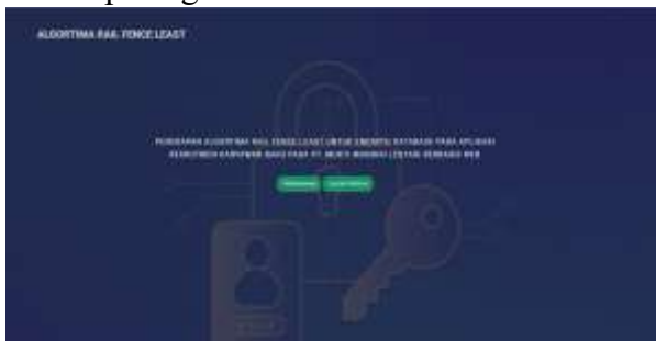
Gambar 1. Tampilan Home Sistem

Tampilan ini merupakan tampilan awal yang dapat dilihat oleh user untuk mengetahui beberapa menu yang ada di system rekrutmen karyawan Baru yang terdiri dari menu perusahaan dan menu calon pekerja, Seperti dilihat pada gambar di bawah ini: