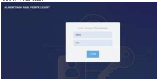
Gambar 2 Menu Login Perusahaan

Menu ini digunakan oleh perusahaan untuk bisa masuk kedalam sistem rekrutmen karyawan baru, seperti dilihat pada gambar dibawah ini: