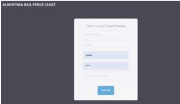
Gambar 7. Tampilan Menu Daftar Sebagai Pekerja

Pada menu ini calon pekerja mendaftarkan diri untuk mendapatkan username dan password agar masuk ke dalam sistem rekrutmen karyawan baru, Seperti pada gambar di bawah ini: