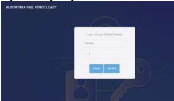
Gambar 6. Tampilan Menu Login Calon Pekerja

Menu ini terdiri dari menu login dan registrasi, untuk para calon pekerja diharapkan untuk registrasi dulu untuk mendapatkan username dan password agar bisa akses ke menu sistem, dapat dilihat pada gambar di bawah ini: