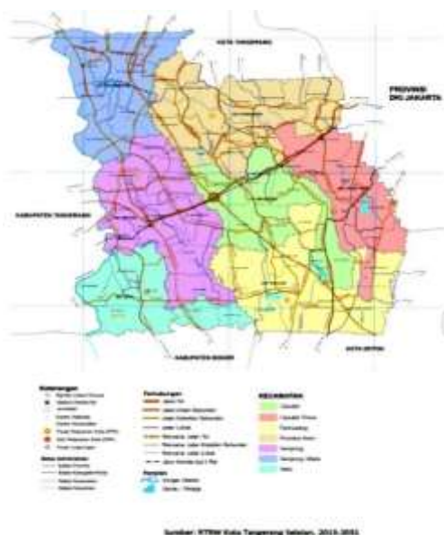
Gambar 1. Peta wilayah Kota Tangerang Selatan

Tepat kegiatan adalah di RW08, Kelurahan Bambu Apus, Kecamatan Pamulang, Kota Tangerang Selatan, Banten. Kota Tangerang Selatan terletak di bagian timur Provinsi Banten yang secara administratif terdiri dari 7 kecamatan dan dan 54 kelurahan (Gambar 1). Salah satu kecamatannya adalah Pamulang yang terdiri dari 8 kelurahan yaitu Pamulang Barat, Pamulang Timur, Pondok Benda, Benda Baru, Kedaung, Bambu Apus, Pondok Cabe Ilir (Gambar 2) . Kelurahan Bambu Apus terdiri dari 9 RW dengan jumlah penduduk sebanyak 19.705 jiwa. Salah satu RW di Kelurahan Bambu Apus yaitu RW 08 yang terdiri dar 4 RT. Jumlah keluarga di RW 08 tercatat sebanyak 200 KK dengan jumlah penduduk 700 jiwa.