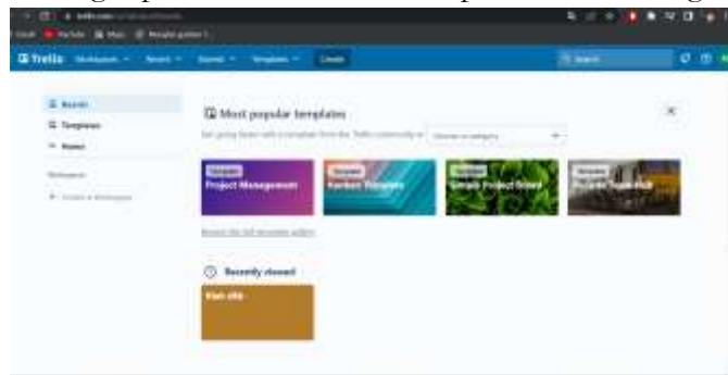
Gambar 3. Tampilan Trello