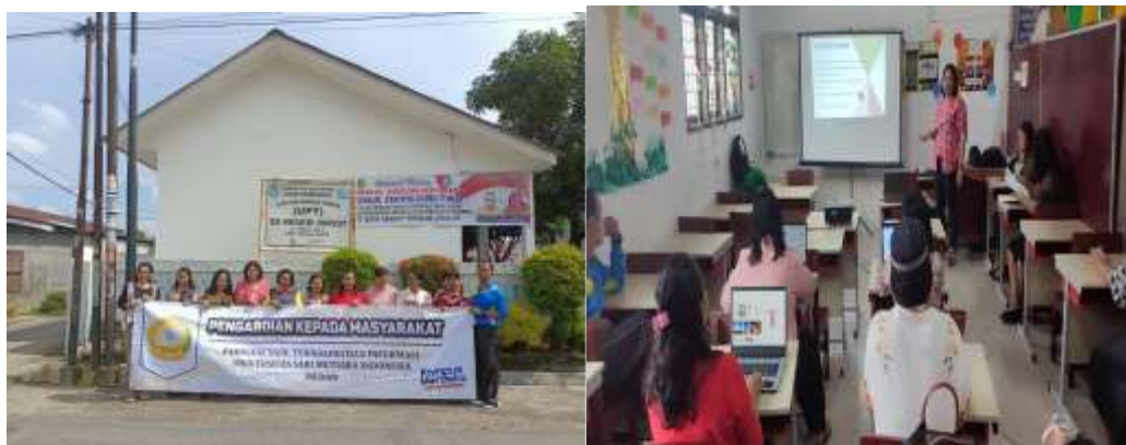
Gambar 4. Pengabdian kepada Masyarakat di SDN 060937 Kotamadya Medan

Trello merupakan aplikasi google bebas bayar yang fungsi utamanya untuk membantu dalam memberikan materi pelajaran, latihan materi pelajaran, soal ujian dan kuis secara tatap muka terbatas yang dapat didownload oleh guru maupun siswa. Trello inilah salah satu alat yang mudah digunakan bahkan bagi para pemula sekalipun karena tidak menggunakan koding untuk pembuatannya dan menjadi ruang diskusi. Trello juga dapat dikolabosarikan dengan situs atau media lain contohnya instagram, facebook dan youtube. Fakultas Sains, Teknologi dan Informasi Universitas Sari Mutiara Indonesia dalam melaksanakan darma yang ketiga yaitu pengabdian kepada masyarakat dengan melaksanakan edukasi Trello bagi guru SDN 060937 di Kotamadya Medan secara online dan offline. Kegiatan pengabdian kepada masyarakat (PKM) pada Gambar dibawah ini.