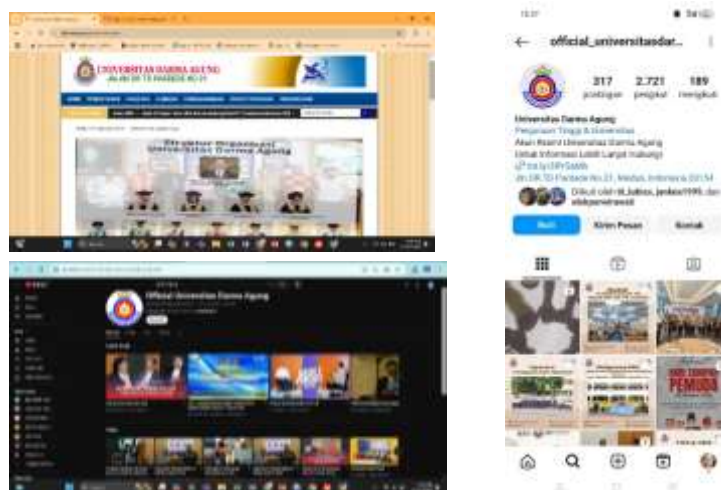
Gambar 1 : Media Publikasi Universitas Darma Agung

Dari observasi yang dilakukan, bahwa Universitas Darma Agung sudah memiliki media informasi seperti website, akun youtube, dan Instagram, seperti berikut :