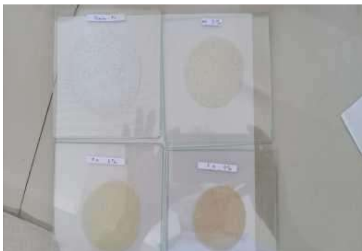
Gambar 3 Hasil Pengamatan Uji Homogenitas

bahan kasar. Hal ini menunjukkan bahwa sediaan krim Ekstrak etanol buah bit memiliki tekstur homogen.