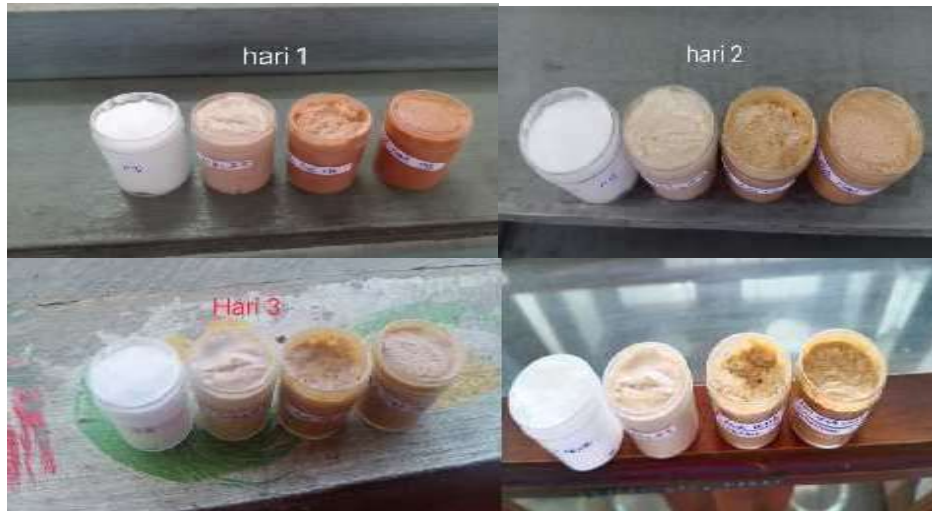
Gambar 1 Pengamatan Organoleptis Per Hari

termasuk sediaan yang stabil apabila di simpan lama, mungkin hal ini terjadi karena pada formula sediaan dilakukan penambahan pengawet yang masih sesuai dengan standar.