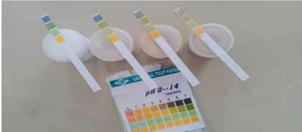
Gambar 2 Hasil Pengamatan pH